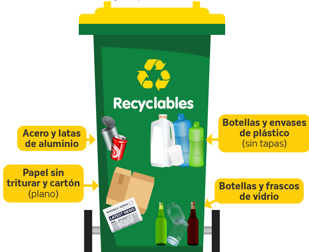
Contenedor de Papel y cartones